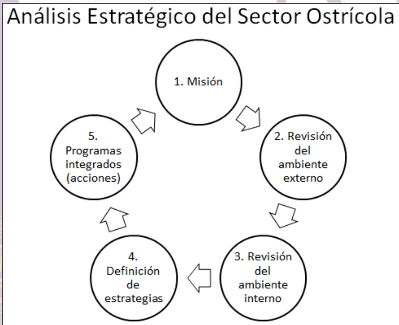
Figura 2. Análisis Estratégico del Sector Ostrícola